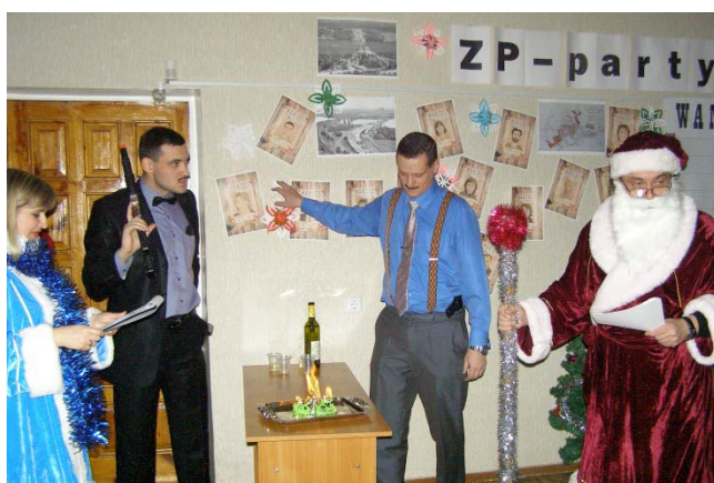
Колективи художньої самодіяльності