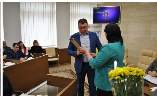
Обласна нарада за участю заступника міністра юстиції по Державній виконавчій службі