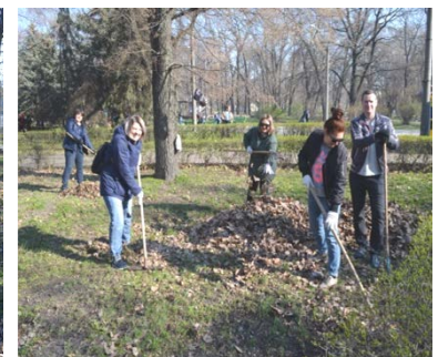
Участь у Днях довкілля