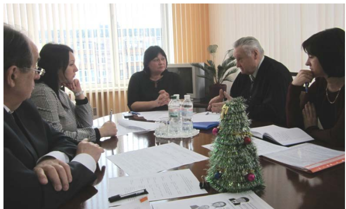
Круглий стіл з Регіональним представником Секретаріату Уповноваженого Верховної Ради України з прав людини по Запорізькій області, Запорізькою обласною федерацією роботодавців, Запорізькою обласною радою профспілок