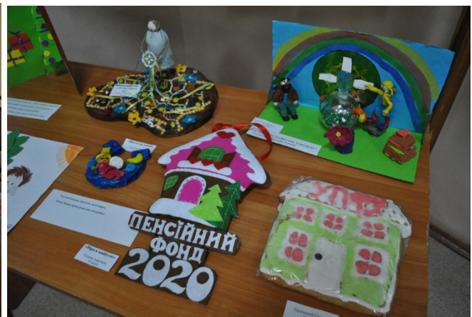
Конкурс малюнку дітей працівників Фонду «Пенсійний фонд очима дітей»