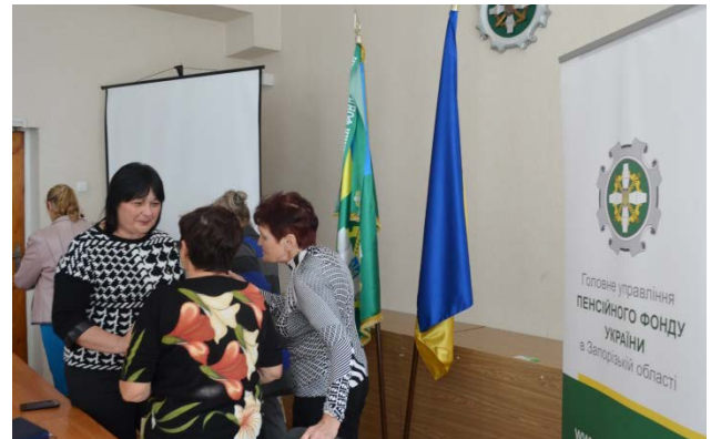
Круглий стіл з ветеранами області