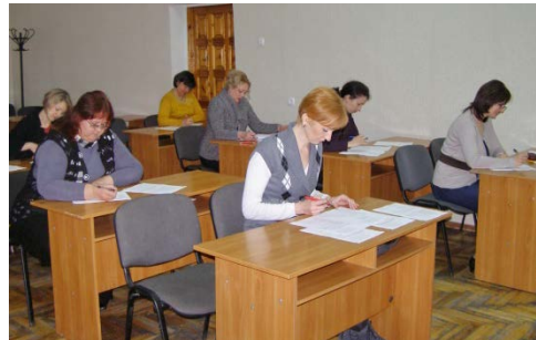
Проведення конкурсу «Кращий Державний службовець»