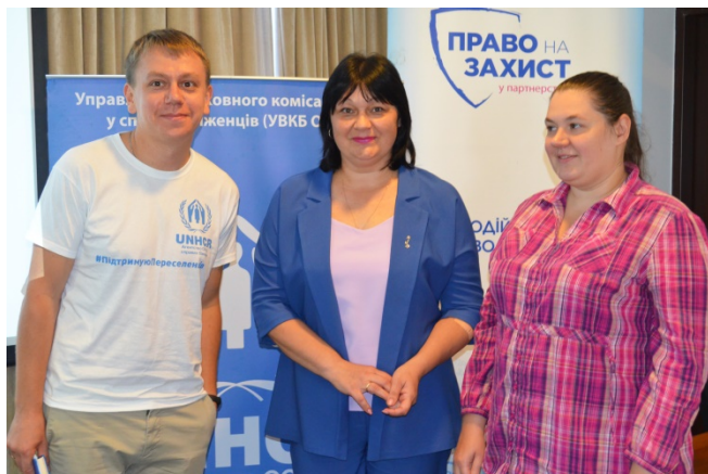
Участь у семінарі з ВПО в рамках зустрічі регіонального офісу Управління Верховного комісаріату ООН у справах біженців