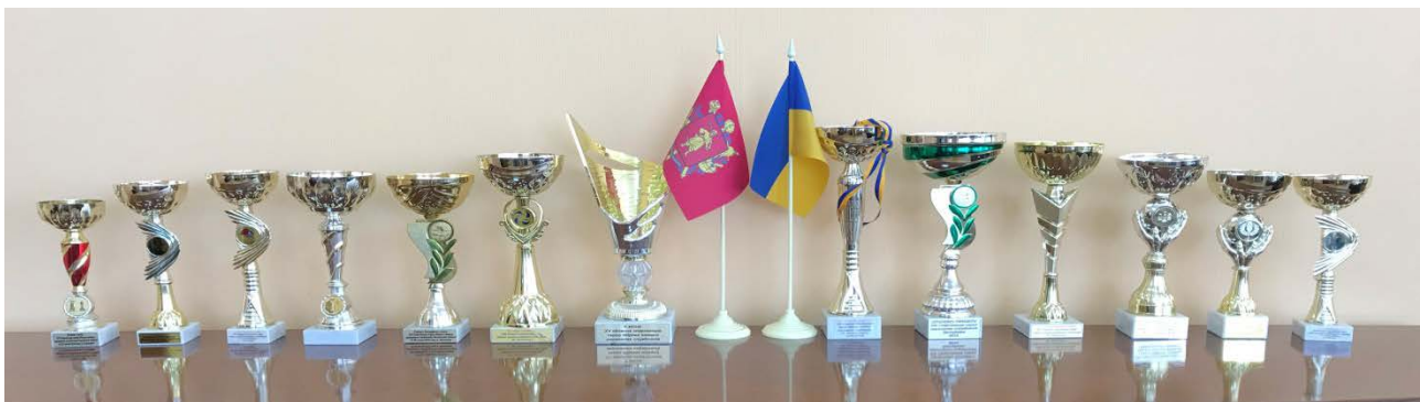
Переможці всеукраїнських, обласних спортивних змагань та заслужені нагороди