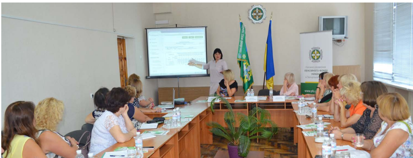
Круглий стіл з профспілками підприємств