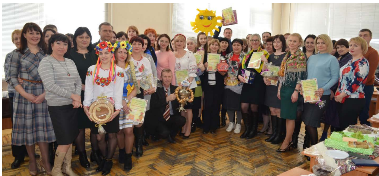
Масляна (день млинів)