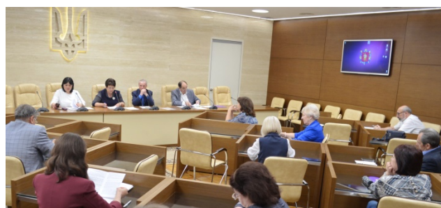
Засідання обласної координаційної ради сприяння зайнятості населення