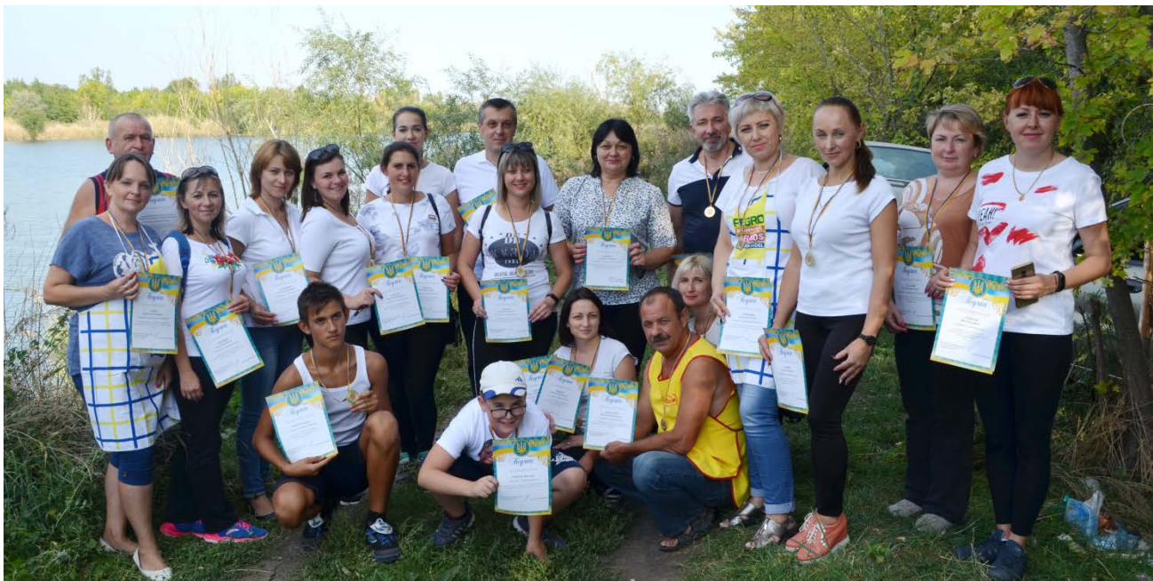
Велопробіг у м.Пологи