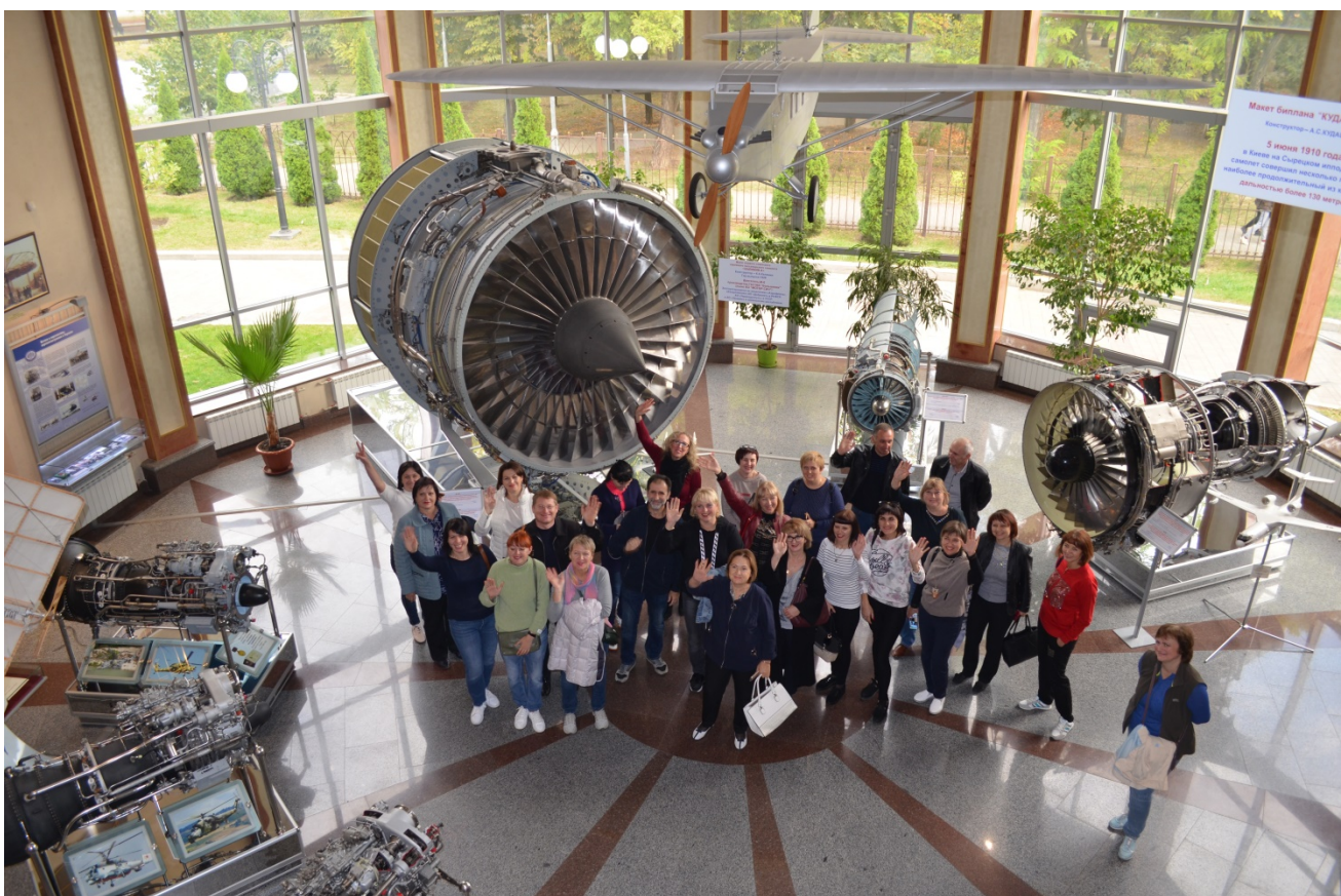
Разом відпочиваємо (кінний театр, прогулянка на катері навколо о. Хортиця, музей техніки Богуслаєва)