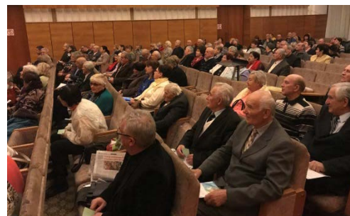
Звітно-виборча конференція Запорізької обласної організації ветеранів України